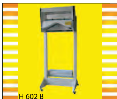
H 602 B