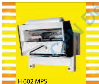
H 602 MPS

* porte bobine double sur partie inférieure