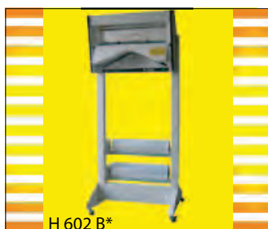
H 602 B*