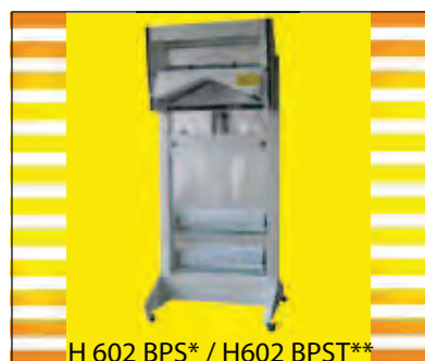
H 602 BPS* / H602 BPST**

* porte bobine double sur partie inférieure