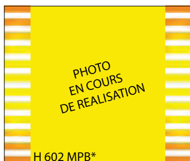
H 602 MPB*